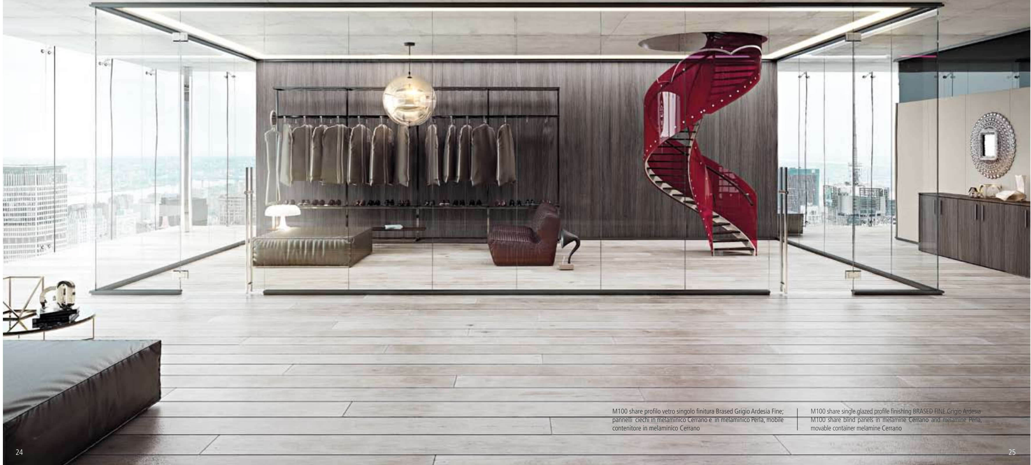
M100 share profilo vetro singolo finitura Brased Grigio Ardesia Fine; pannelli ciechi in melaminico Cerrano e in melaminico Perla, mobile contenitore in melaminico Cerrano