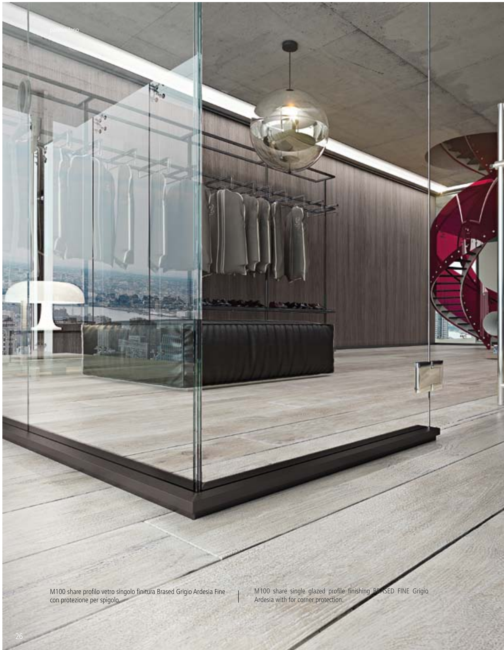
M100 share profilo vetro singolo finitura Brased Grigio Ardesia Fine con protezione per spigolo.